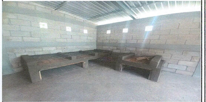
Foto 4: ÁREA DONDE SE REALIZÓ EL MEJORAMIENTO CON INSTALACIÓN DE POLLETON.

Observación: Si es necesario se pueden agregar hojas adicionales y actualizar el número de hojas.